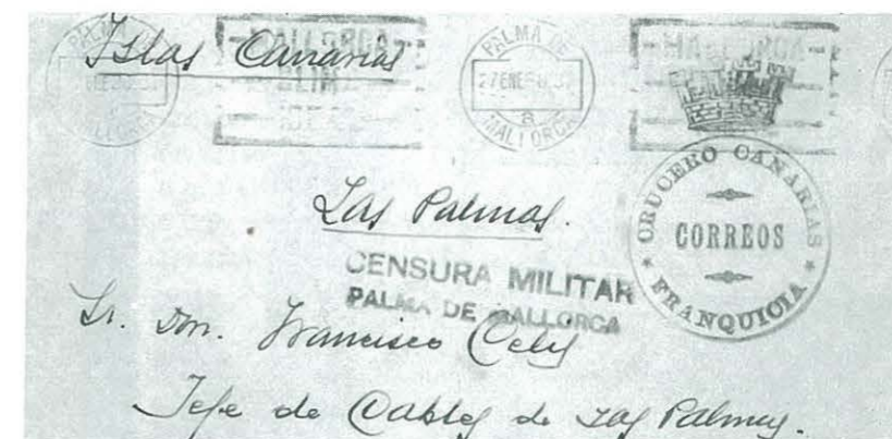
Núm. 15.- Sobre circulat entre Palma de Mallorca i las Palmas de Gran Canaria amb Franquícia de Correus del Crucero Canarias. Mata-segell de 27-01-38. Porta Censura postal de sortida a tinta morada "Censura Militar-Palma de Mallorca". Carta franquista. (Col·lecció particular de Julio Allepuz).

Al marge de la seua aportació benèfica, moltes vegades aquests segells foren l'únic franqueig que portaven les cartes, tant civils com militars. Aquest cas és el que apreciem a la il·lustració núm. 17 que reproduïm, on s'aprecia que es tracta d'un sobre circulat sense franquícies ni segells de correus de cap tipus. Solament amb una simple vinyeta propagandística de Falange la carta va poder circular sense cap tipus de problema.