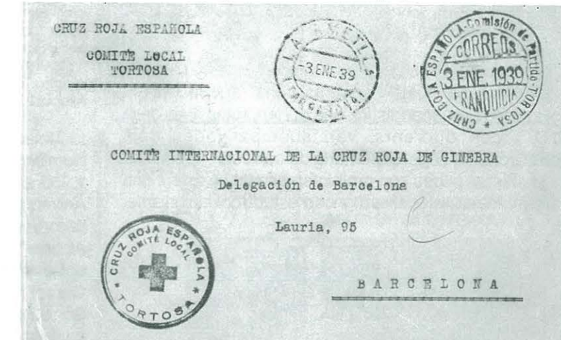
↑ Núm. 16.- Sobre circulat entre l'Ametlla de Mar i Barcelona amb Franquícia postal de "Cruz Roja Española- Comisión de Partido-Tortosa". Mata-segell de sortida de l'Ametlla de data 3 de gener 1.939. Opinem que el Comitè Local de Creu Roja de Tortosa estava desplaçat fora del seu lloc habitual en ser evacuada Tortosa després del bombardeig del 14 d'abril de 1.938 i establir-se allí el front de primera línia durant 270 dies. A l'Ametlla les tropes franquistes van arribar el dia 14 de gener 1.939, onze dies després de posar-se en circulació aquesta carta. Carta republicana (Col·lecció part. J. Allepuz).