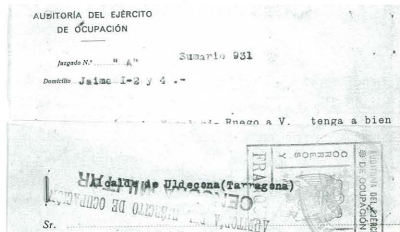
Núm. 13.- Full plegat amb grapa metàl·lica i circulat sense sobre des de Saragossa a Uldecona amb Franquícia de Correus i Telègrafs que l'"Auditoria del Ejército de Ocupación". Porta al revers un mata-segell de correus d'arribada a Uldecona de data 28-10-38. Carta franquista del període de la Batalla de l'Ebre. Porta censura militar de sortida. (Arxiu Històric Municipal d'Uldecona).

Les il·lustracions que s'acompanyen, la núm. 13, 14, 15 i 16, són una petita mostra de cartes circulades amb franquícia postal